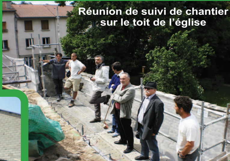
Réunion de suivi de chantier sur le toit de l'église